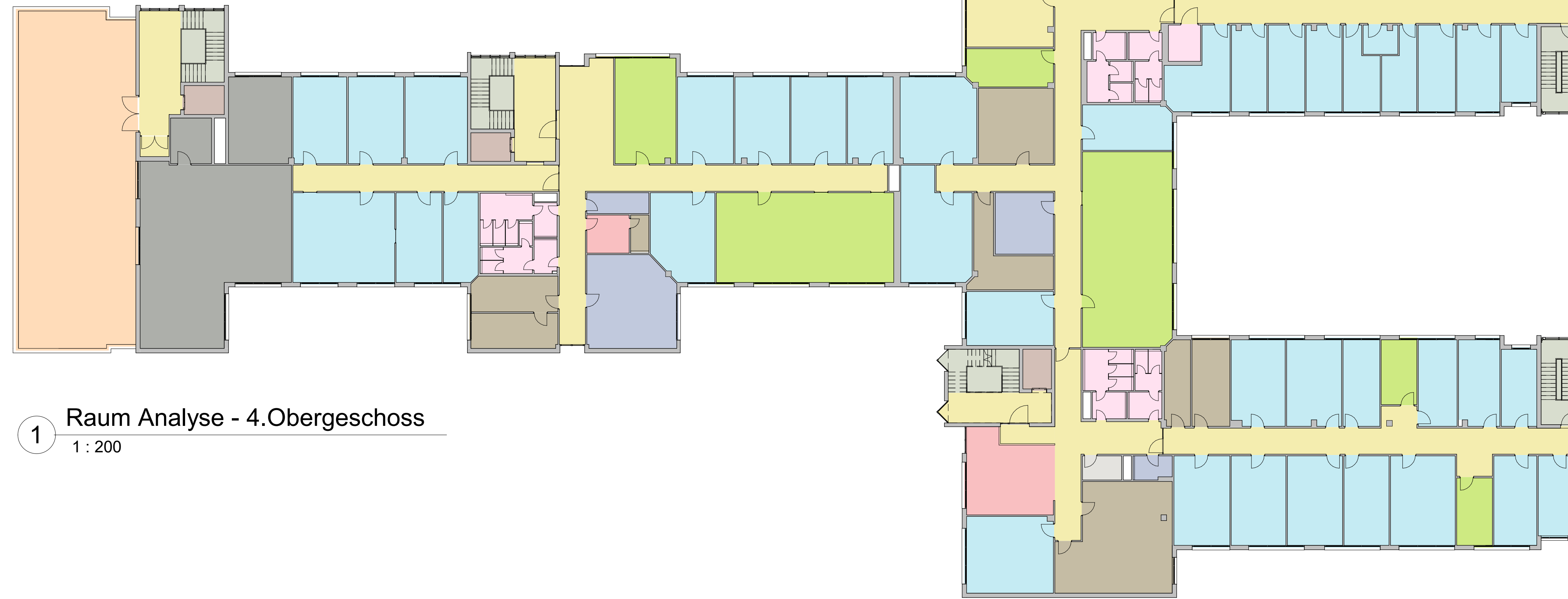
1 Raum Analyse - 4.Obergeschoss 1 : 200